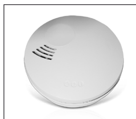
X Serie Heimrauchmelder